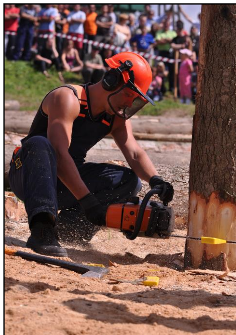
8. Dzień Żubra - zawody drwali

Ponadto prężnie rozwijającą się branżą są usługi agroturystyczne. Obecnie zajmuje się nią 6 osób. We wsi 29 osób prowadzi gospodarstwa rolne. Ponadto największymi zakładami pracy są Zespół Szkół w Lutowiskach, Urząd Gminy i Nadleśnictwo Lutowiska.