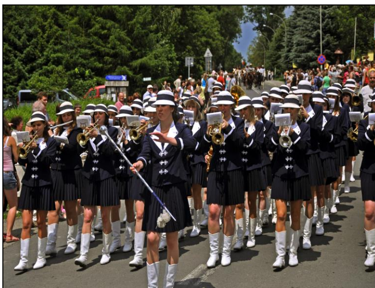
10. Targi Końskie