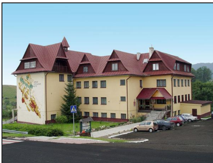
6. Urząd Gminy