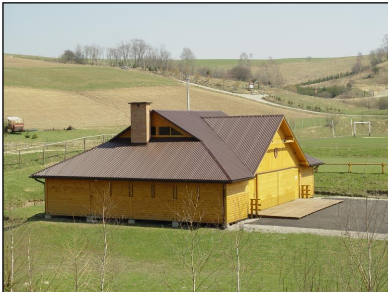
7. Chata pod Florianem

Lutowiska są w 87 % skanalizowane i w 95% zwodociągowane. Woda dostarczana jest z ujęcia powierzchniowego i 2-ch studni głębinowych. Ścieki odprowadzane są do 2-ch oczyszczalni należących do Gminnego Zakładu Gospodarki Komunalnej w Lutowiskach. Obecnie trwają roboty budowlane przy budowie nowej biologiczno – mechanicznej oczyszczalni ścieków i sieci kanalizacji sanitarnej.