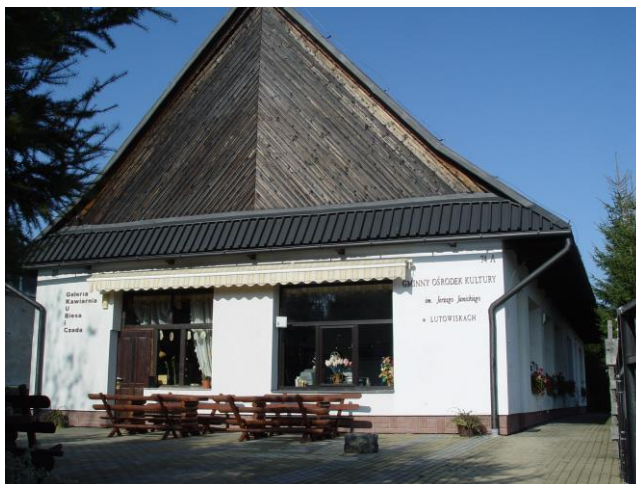
11. Gminny Ośrodek Kultury