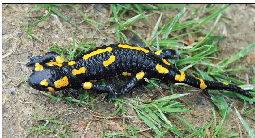
3. Salamandra plamista

Flora Lutowisk i okolic stanowi połączenie roślinności piętra pogórza (500 m n.p.m.) i regla dolnego (500-1150 m n.p.m.). Spotykają się tutaj i przenikają zbiorowiska nizinne i górskie, m. in.: olszynka