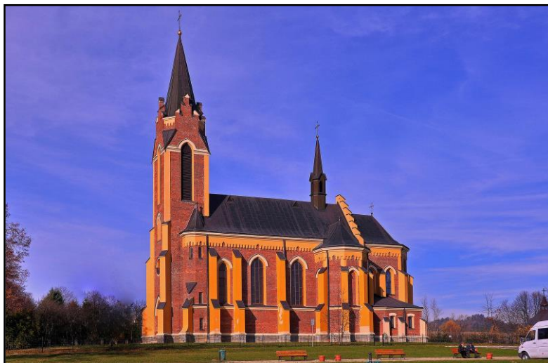
2. Neogotycki kościół

rozpościera się widok na całą wieś i wysokie Bieszczady. Dominującym elementem w krajobrazie jest neogotycki zabytkowy kościół. Miejscowość jak na warunki bieszczadzkie ma dość zwartą zabudowę zlokalizowaną wzdłuż drogi wojewódzkiej i dróg gminnych. Standardem w architekturze budynków strome dachy o nachyleniu 35° – 45°. Domy w większości posiadają dwie kondygnacje w tym 2-ga w poddaszu.