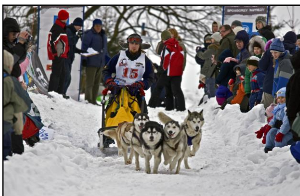
9. Wyścigi psich zaprzęgów