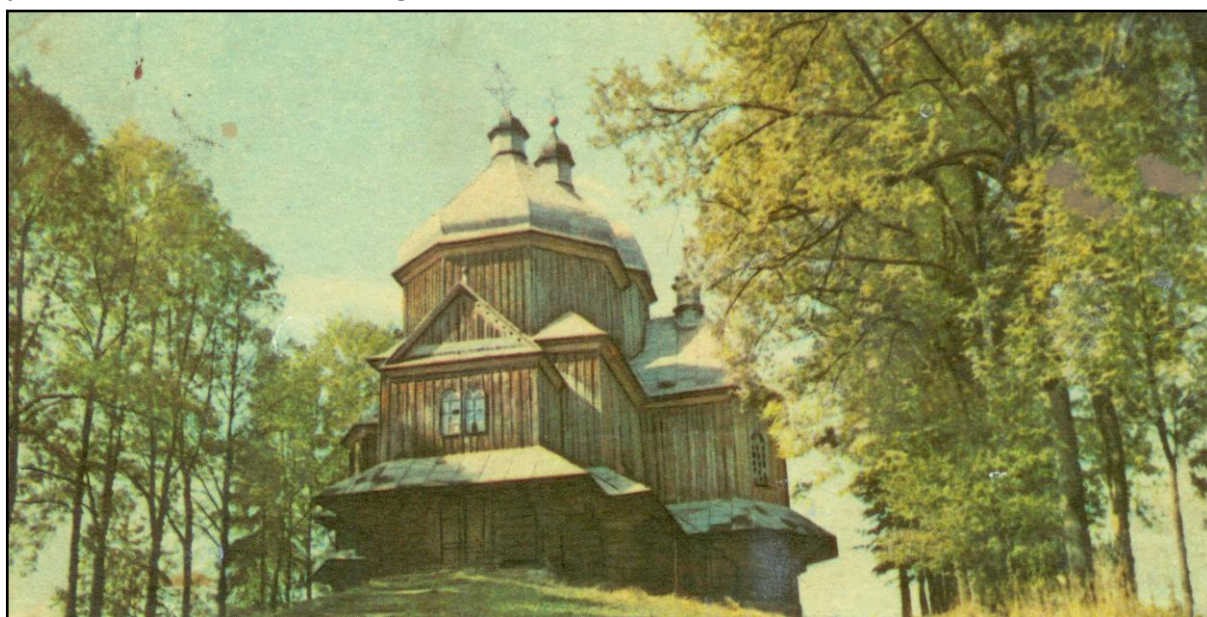
1. Dawna cerkiew w Lutowiskach