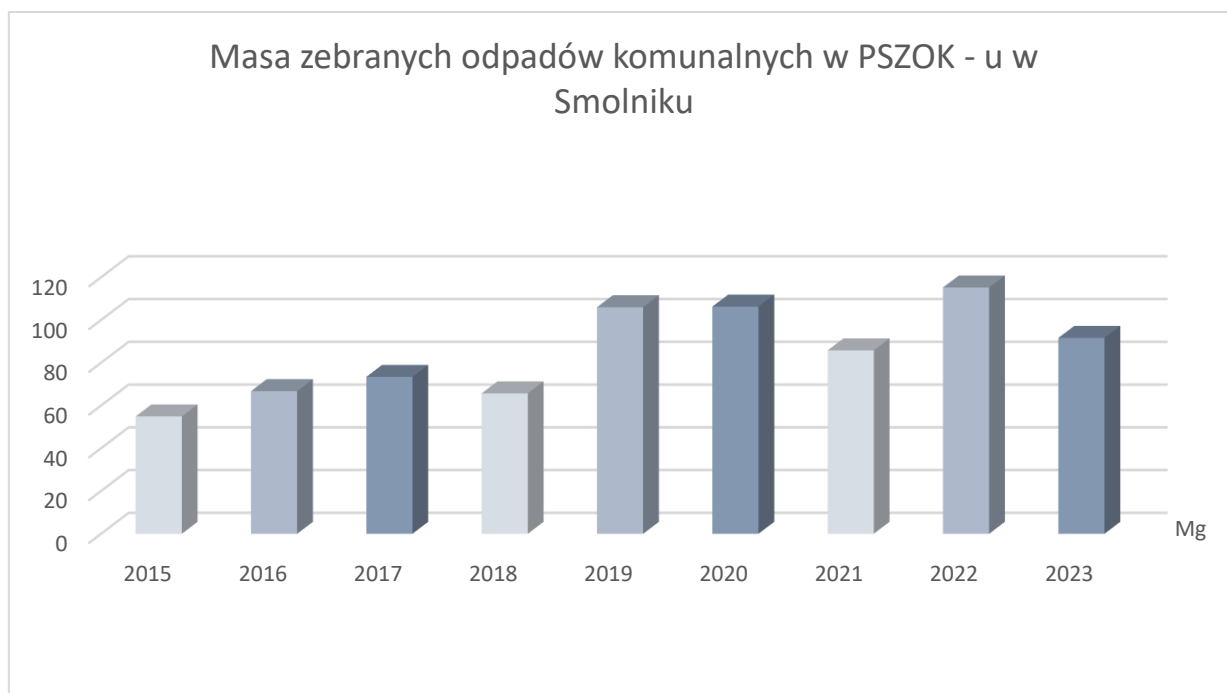
Wykres 2. Porównanie ilości przyjętych od mieszkańców gminy odpadów komunalnych w Pszok – u od 2015 r.